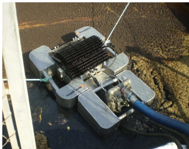
MS10 udružen sa pneumatskom pumpom na pontonu