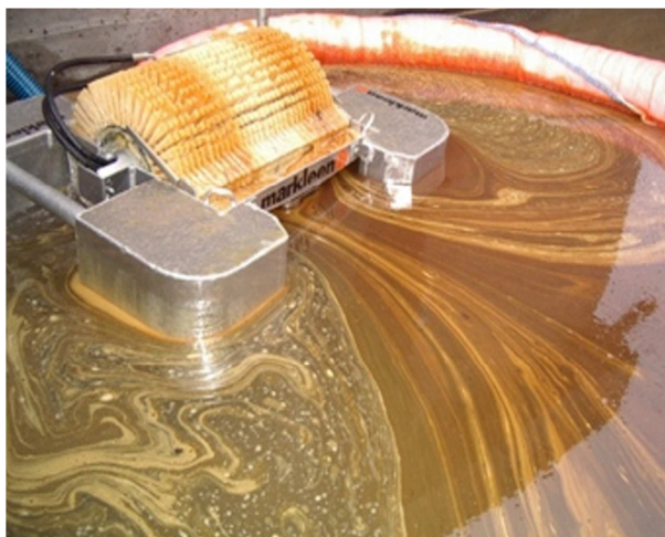
MS10 sa modulom četke